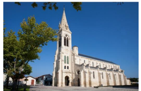
Eglise de Carcans

Le + : Possibilité de déguster des huîtres durant le séjour, en supplément à réserver sur place en début de séjour.