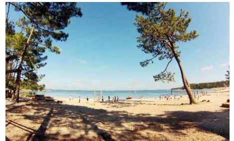
Le lac de Carcans

Le programme d'activités est donné à titre indicatif et est susceptible d'être aménagé selon les conditions météorologiques ou la disponibilité du prestataire. Le programme détaillé sera transmis aux organisateurs au plus tard 7 jours avant le début du séjour. Piscine chauffée à disposition sur le centre, plage du lac à 400 m et plages océanes à 7 km, n'oubliez pas votre tenue de bain !